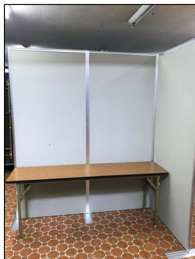
図：展示ブースイメージ写真